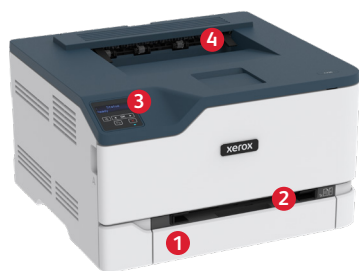
Xerox ® C230 színes nyomtató